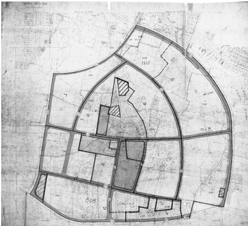
איור 1 : תוכנית 460

תוכנית 460 שיקפה את השאיפה להחליף מציאות מרחבית אחת באחרת, או ליתר דיוק, להחליף מרחב שהתקיים "ללא סדר הגיוני" (שם, 29) בארגון מרחבי סדור. שינוי מערכת הדרכים מבטא בבהירות את התפיסה הזאת. כמו שאפיין קרטור את ההיסטוריה המרחבית, כך אפשר להתחקות אחר ההתפתחות של הכפר סלמה כהיסטוריה של דרכים ושכילים: מיקומו של הכפר כחמישה קילומטרים ממזרח ליפו לא היה מקרי ונבע במידה רבה מהקרבה לדרך הראשית המובילה מיפו מזרחה אל הערים לוד, רמלה וירושלים, וכן לדרך ההיסטורית המחברת את צפון מישור החוף עם דרומו. דרכים הכתיבו במידה רבה גם את התפתחות הבנייה בתוך הכפר, שנעה ממרכזו לאורך הדרכים המובילות מערבה ליפו, לצפון-מערב לכיוון תל-אביב, ודרומה לעבר מסילת הברזל לירושלים והכפר השכן יאזור. גם הארגון המרחבי הפנימי בסלמה התעצב מתוך התייחסות לאופן שבו שכילים ודרכי גישה מבחינים בין המרחב הפרטי לציבורי: בחינת הבעלות על החלקות מגלה שחלוקת המרחב בכפר התבססה על תלות הדדית בין חזקה פרטית ובין נגישות למרחב הציבורי